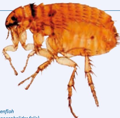
Katzenfloh ( Ctenocephalides felis )

Um die kleinen Parasiten zu identifizieren, kämmen Sie Ihr Tier gründlich – am besten mit einem Flohkamm – auf einer hellen Unterlage (z. B. einem Stück Küchenrolle). Kleine schwarze Körnchen im Kamm oder auf der Unterlage,