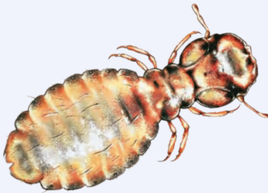
Haarling ( Trichodectidae )

Ein schütteres, ungepflegtes Haarkleid und ein verändertes Verhalten sind Hinweise auf einen Parasitenbefall. Wenn Ihr Tier unruhig und schreckhaft ist und durch vermehrtes Kratzen auffällt, sollten Sie das Fell untersuchen: Läuse und Haarlinge sind ca. 2 Millimeter groß. Mit bloßem Auge oder einer Lupe kann man kleine, sich bewegende Striche im Fell erkennen. Außerdem kleben beide Parasitenarten ihre Eier an die Haare ihres Wirtstieres. Eine genaue Diagnose erfolgt unter dem Mikroskop.