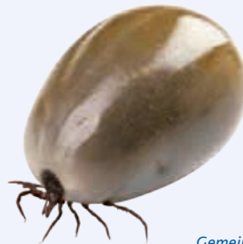
Gemeiner Holzbock, vollgesogen ( Ixodes ricinus )