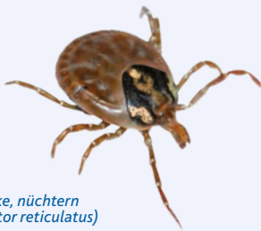
Auwaldzecke, nüchtern ( Dermacentor reticulatus )