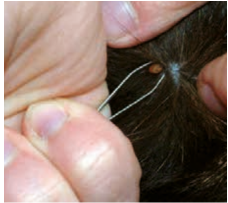
Entfernen einer Zecke mit einer Zeckenzange